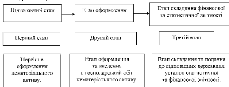
Рис. 1. Загальна схема здійснення фінансово-облікової політики використання нематеріальних активів

З метою розвитку формування фінансово-облікової політики використання нематеріальних активів та їх документального оформлення пропонуємо модель здійснення фінансово-облікової політики використання нематеріальних активів (рис. 1).