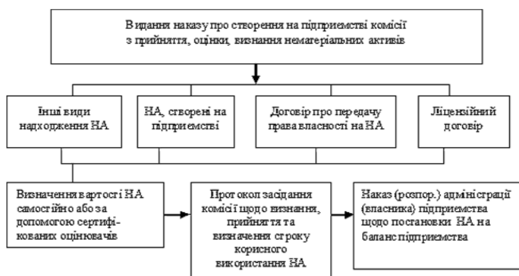
Рис. 2. Підготовчий етап

Перший етап — це підготовчий етап, або етап первісного оформлення документів (рис. 2).