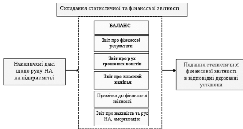
Рис. 4 Етап складання фінансової та статистичної звітності

Третій етап — це етап складання бухгалтерської та фінансової звітності і подання її до відповідних державних установ (рис. 4).